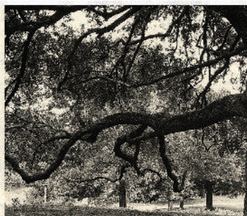
SERIE DIÁLOGOS IX, 2021. 43 x 86 cm