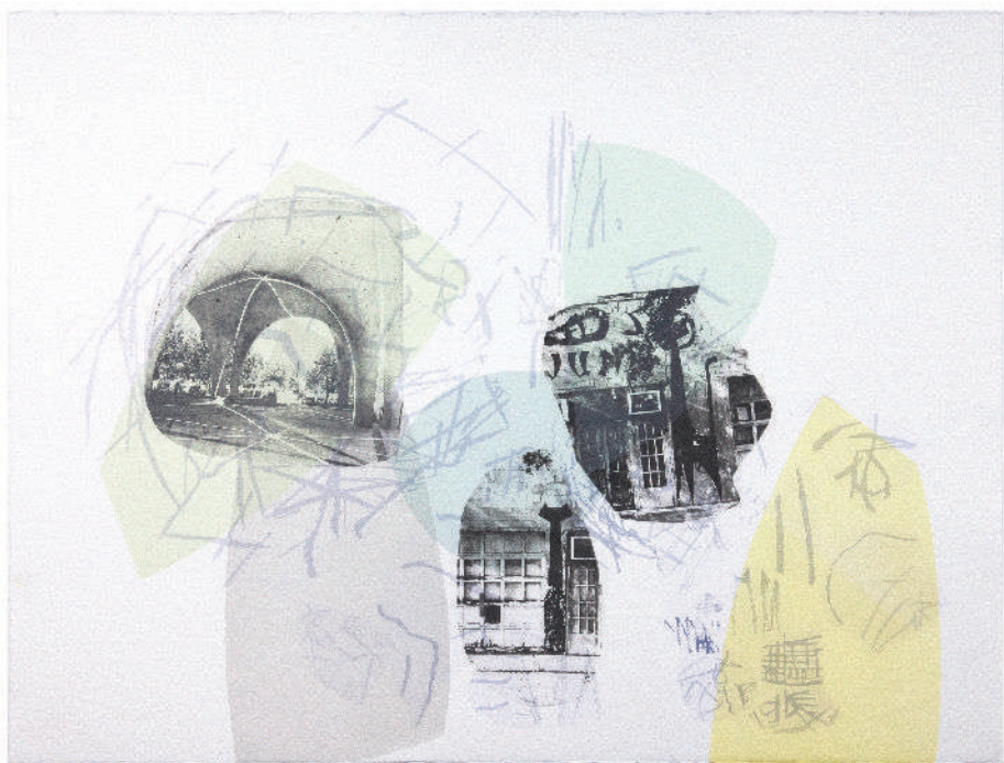
19 DE LA SERIE TIME TRAVELS-CONFLUENCE II, 2020. 56 x 76 CM