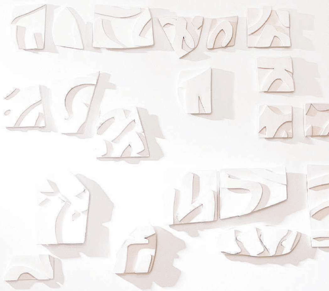
TABLATURA, 2022 (MURAL) 110 X 140 CM