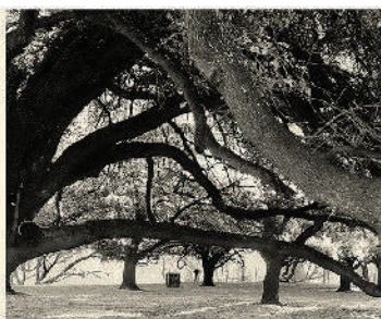
SERIE DIÁLOGOS III, 2021. 43 x 86 cm