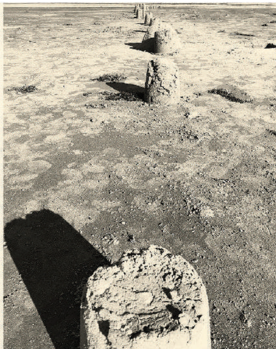
SERIE DIÁLOGOS VII, 2021. 43 x 68 cm