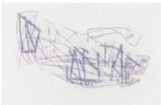
04 DE LA SERIE TRANSICIONES, 2020. COLLAGE, 21,6 x 14 CM APROX.